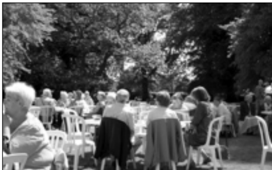
Glimt fra et hjørne af grundlovsfesten i Astrup præstegårdshave, som rigtig mange - unge og gamle - var med til at fejre på en smuk solskinsdag.