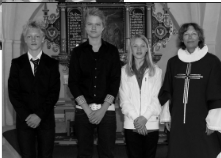
Hvilsted den 3. maj 2009 kl. 9.30