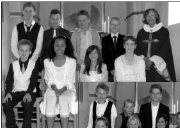
Astrup den 3. maj 2009 kl. 11