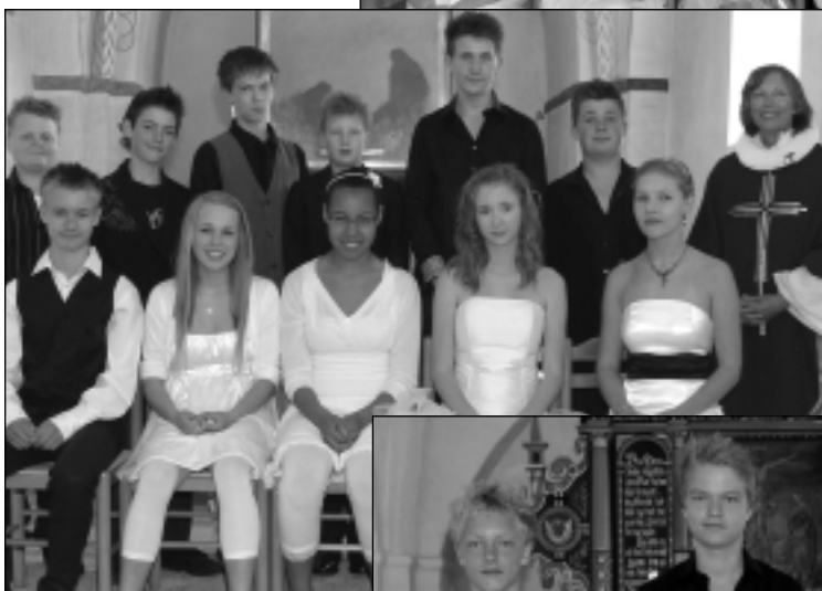
Astrup den 10. maj 2009 kl. 11