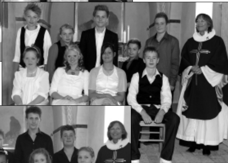
Astrup den 10. maj 2009 kl. 9.30